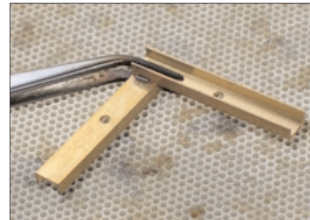
Teile zusammenhalten (hier mit Lötpinzette), kleines Stück Lötzinn an Spalt legen.