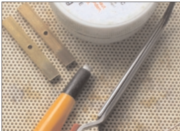
Löffflächen blank machen, geht gut mit einem Glasradierer.