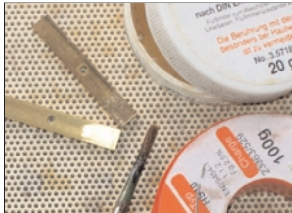
Lötfett (verwende ich) dünn auftragen, geht gut mit einem älteren Pinsel.