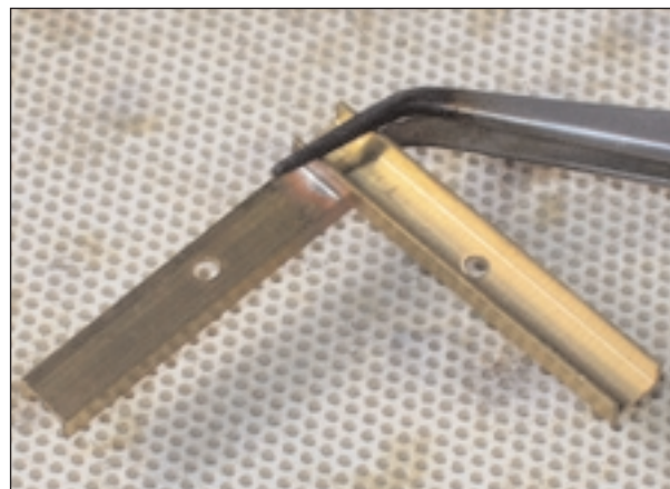
Lötstelle kontrollieren: Hätte noch etwas weniger Lötzinn sein können!